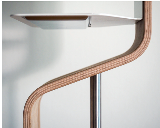
Zweifach gebogenes Formholz, Edelfurnier auf Buchekern, Klarlack, B1 zertifiziert