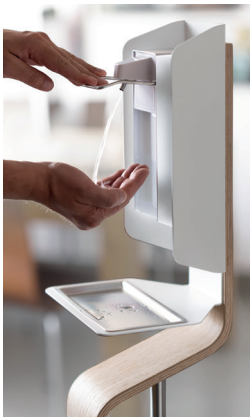
H.U.G.O. motiviert formvollendet zur Händedesinfektion

Der Spender selbst ist in einer ergonomisch sinnvollen Höhe angebracht. Die Abtropfschale aus Edelstahl darf zur Reinigung komfortabel in die Spülmaschine. Der Eurospender in genormter Ausführung erlaubt ein praktisches Handling von handelsüblichen 500-ml-Behältern mit Händedesinfektionsmittel und -gel, Flüssigseifen oder dünnflüssigen Lotionen. Zur Sicherung einer langen Lebensdauer erlaubt das Spendersystem den spezifischen Tausch der Pumpe. Das Gehäuse kann zudem im Autoklav desinfiziert und gereinigt werden.