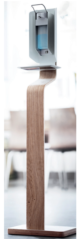
Zieht Blicke auf sich: H.U.G.O.