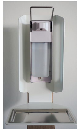
Genormter Eurospender für 500 ml