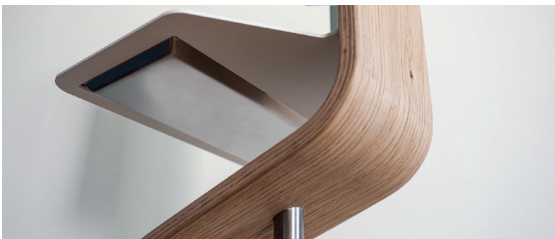
Natürliche Materialien aus nachhaltiger Produktion, Stück für Stück unvergleichlich.